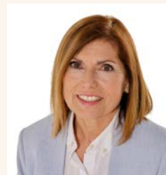
Rosa Huguet i Sugranyes La vostra alcaldessa

És un moment molt bonic, en què recuperem poder sortir al carrer i compartir aquests moments amb amics i familiars, sempre amb seguretat. Les entitats tenen molta il·lusió de tornar al carrer. És un moment de recuperació en què compartirem gastronomia, música, cultura, motor, entitats i artesanian. I, per sobre de tot, és moment de trobar-nos amb familiars, veïns i amics.